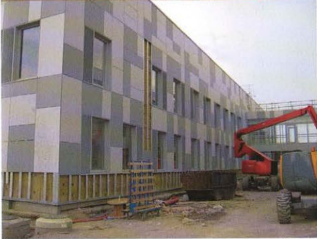
L'un des deux bâtiments neufs : Kitchen, avec sa façade rideau inclinée qui a à la fois une fonction solaire passive (vitrage) et une fonction solaire active (capteurs photovoltaïques).